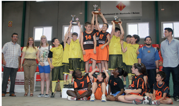
Els primers classificats de cada esport van recollir els trofeus de mans de les autoritats i dels representants del CDEM

Pilar Abián | Pla d'en Coll Unes 650 persones –entre esportistes, monitors i representants de les escoles– van participar el 2 de juny a la cloenda dels Jocs Escolars, que es va fer al pavelló Miquel Poblet. La festa va començar amb la desfilada dels centres i el lliurament de trofeus als equips que han quedat els primers classificats.