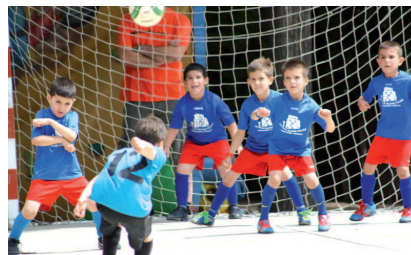
Uns infants de l'Elvira Cuyàs jugant un partit de futbol durant les jornades

tits i altres propostes de caràcter més lúdic. El dia 9, el centre Elvira Cuyàs de Mas Rampinyo també va organitzar les jornades lúdicoesportives, que van ser un èxit d'assistència.