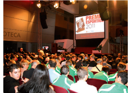
L'Àgora de Montcada Aqua es tornarà a vestir de gala per acollir la festa

La documentació es pot lliurar fins al 20 de juny a l'AOAC