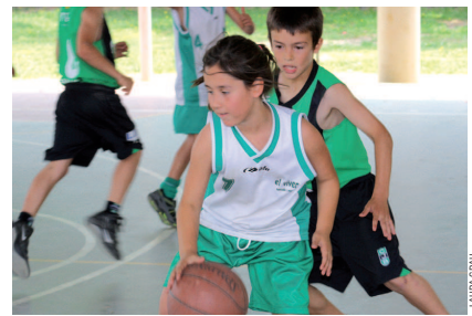
Una nena d'El Viver disputant un partit de bàsquet en la festa de l'escola