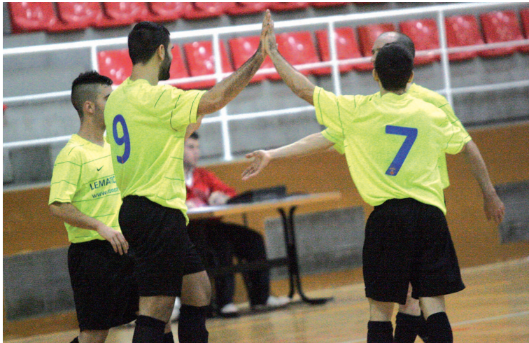
Els jugadors de l'FS Montcada celebren un dels 159 gols que han marcat aquesta temporada a la lliga, en què han acabat campions amb autoritat

L'FS Montcada ha tancat una temporada de somni que l'ha portat a aconseguir l'ascens a la Segona Divisió Nacional B d'una manera brillant. Els homes de Jordi Rozas han acabat primers del Grup Primer de Tercera Divisió amb 82 punts, a 18 d'avantatge respecte el segon classificat, l'FS García de Santa Coloma. Els montcadencs han guanyat un total de 26 partits i n'han empatat 4, sent el segon equip més golejadore de la categoria amb 159 gols i el menys golejat, amb 68 en contra. L'FS Montcada va obtenir el premi de l'ascens quan encara faltaven cinc jornades per al final de la lliga, el passat 5 de maig al pavelló Miquel Poble.