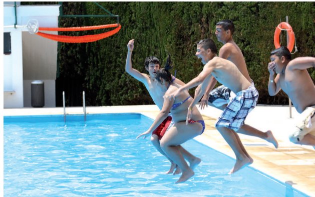
Uns joves es llancen a la piscina gran del carrer Bonavista el primer dia que es va obrir, el passat 9 de juny

La piscina d'estiu al carrer Bonavista ja ha iniciat la nova temporada. Des del 9 de juny i fins al 9 de setembre, l'equipament municipal situat al carrer Bonavista obrirà les seves portes cada dia de 10.30h a 19h. Segons fonts de l'Institut Municipal d'Esports i Lleure, enguany la nova temporada ha despertat força expectació, ja que nombroses persones s'han acostat fins a les oficines del carrer Tarragona per treure's els abonaments. Els carnets familiars amb fills menors de 18 anys costen 130 euros i els individuals 77'20. Per a la gent gran -majors de 65 anys- l'abonament familiar val