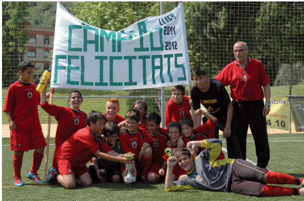
El conjunt aleví A de l'EF Montcada celebrant l'ascens a la Segona Divisió després de guanyar el darrer partit de lliga